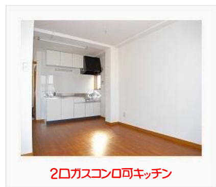
2口ガスコンロ可キッチン