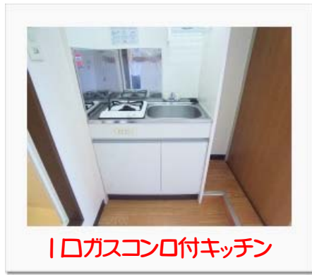
1口ガスコンロ付キッチン

※図面と相違する場合は現況を優先致します。※退室時のルームクリーニング費用及び鍵交換費用は借主の負担となります。※火災保険加入