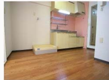
2口ガスコンロ使用可のキッチン