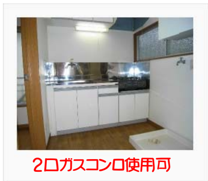
2口ガスコンロ使用可