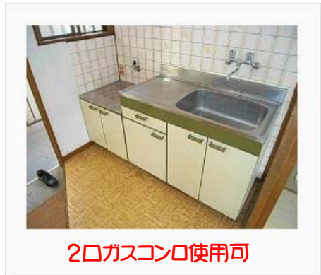
2口ガスコンロ使用可