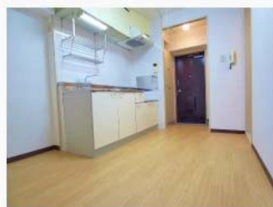
2口ガスコンロ可のキッチン