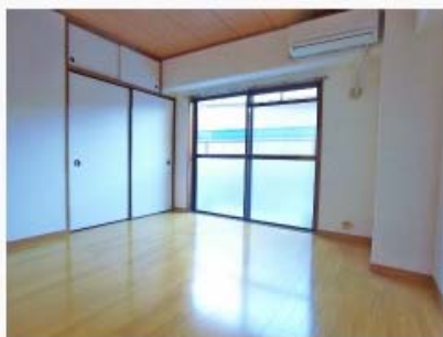
フローリングに改装