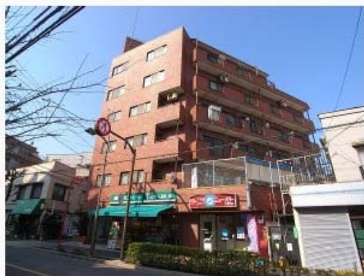
レンガタイル貼の外観

★ 単身赴任者最適! ★シャワー付トイレ! ★1階ミニスーパー・クリーニング店!