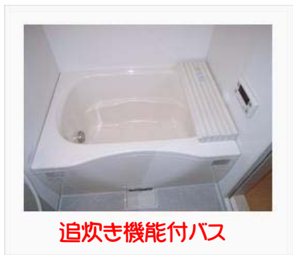
追炊き機能付バス