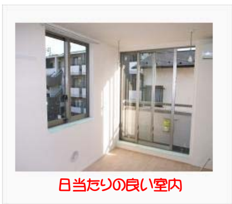
日当たりの良い室内