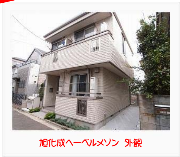
旭化成ヘーベルメゾン 外観

京浜東北線大井町駅徒歩3分 東急大井町線大井町駅徒歩3分 りんかい線大井町駅徒歩3分