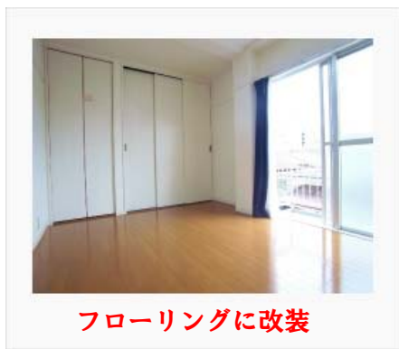
フローリングに改装