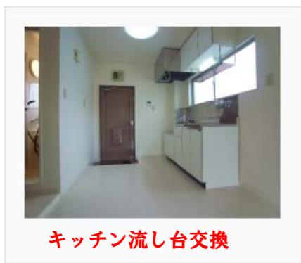
キッチン流し台交換