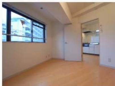
洋間フローリング