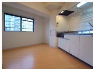
床フローリングのキッチン